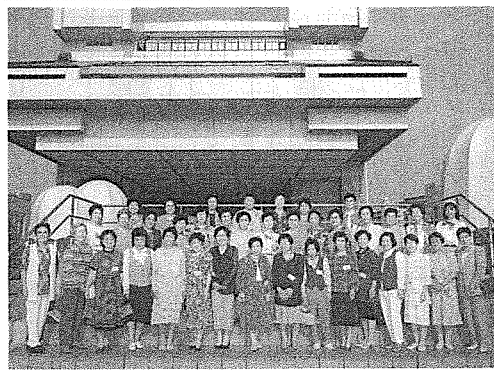
鈴鹿高女東京同窓会 平成8年6月13日 江戸東京博物館

場をおかりして今までのお礼と御冥福をお祈りいたします。また、私は本校の剣道部の顧問として先生の意志を引き継ぎ、やるからには、全国大会への出場はもちろん東海大会や全国大会で優勝できるように選手の育成をし、また勝たなくてはならぬ世の中のために