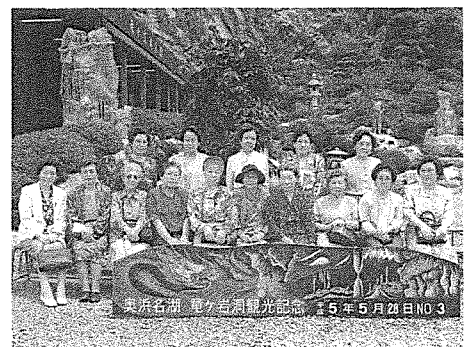
平成5年5月 奥濱名湖竜ヶ岩洞にて

平成五年五月二十七日、二人、二人と減ってまいり十八日は三十一回目の来まして、お手伝いさせてい